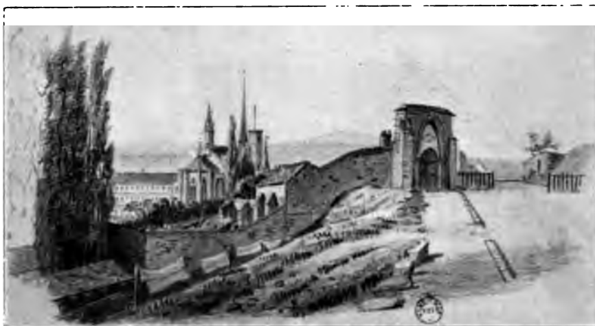
La Chartreuse de Champmol (d'après une ancienne estampe).

Il y avait bien eu, aux XII e et XIII e siècles, dans les grandes abbayes, à Fontevault et à Marmoutiers par exemple, des cuisines bâties sur plan circulaire ou carré, qui formaient des pavillons isolés et possédaient plusieurs foyers ayant chacun son tuyau de dégagement en plus du tuyau central. Au XV e siècle, on renonça généralement à ce mode de construction, et l'on se contenta de larges cheminées, dont la hotte avait une telle ampleur qu'elle abritait souvent des portes communiquant aux offices et à d'autres appartements. Les cuisines de Dijon sont, avec celles de Montreuil-Bellay, les seules qui continuèrent alors en France la